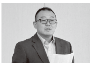
あいさつをする迫副会長