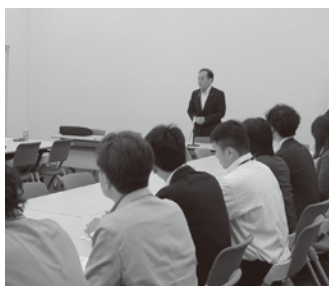
推薦議員との意見交換

引き続き、青年委員会の活動をつうじ、政治への関心や社会との繋がりを身近なものとしていけるよう、役員一同取り組んで参ります。