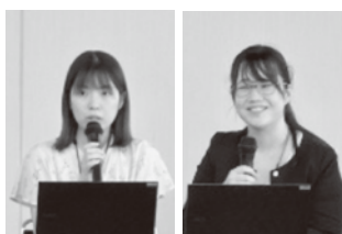
埼玉県の両立支援の取り組み説明

また、第2部では、「埼玉県の両立支援の取り組み」をテーマに、埼玉県産業労働部雇用・人材戦略課ならびに保険医療部疾病対策課から説明を受けました。今後も改正点を前提に、組合活動に活かせるセミナーを企画していきます。来年度もご参加のほど宜しくお願いいたします。