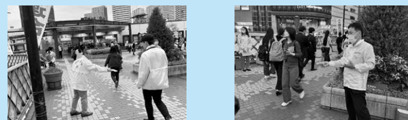
ティッシュ配りの様子