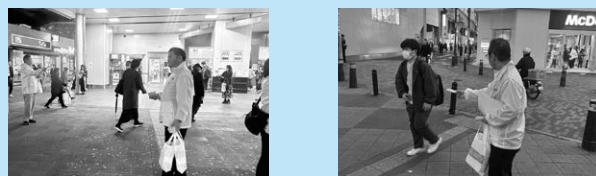
ティッシュ配りの様子