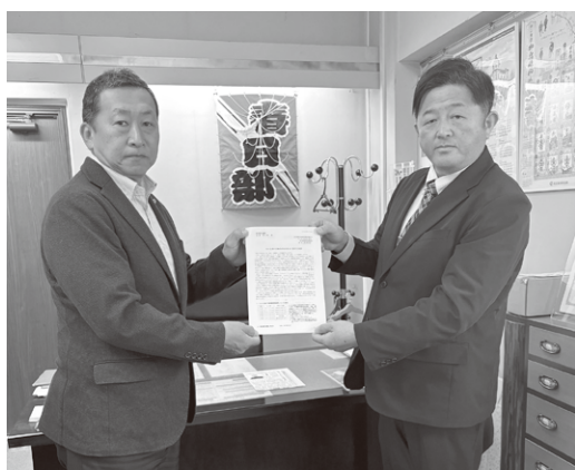
東部地域協議会／庄和商工会