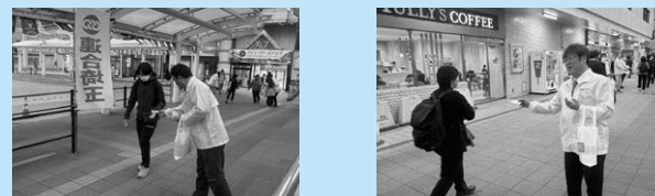
ティッシュ配りの様子