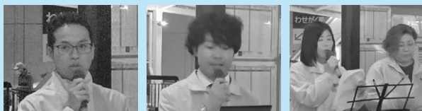
交渉状況報告 龍口執行委員