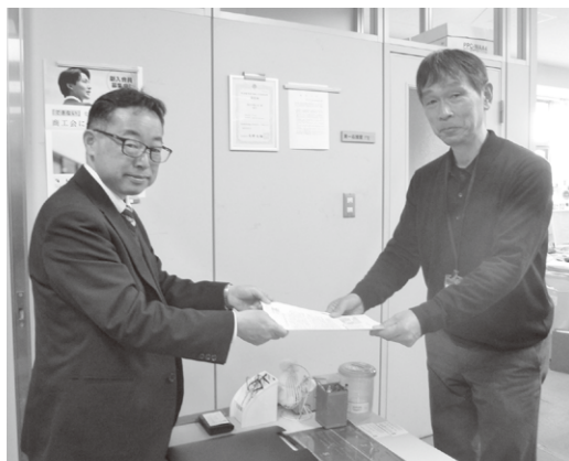
朝霞・東入間地域協議会／朝霞市商工会