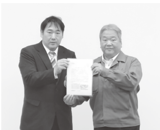
比企地域協議会／東松山市商工会