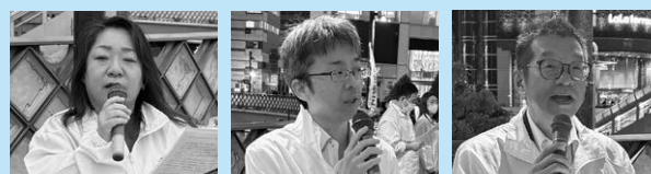
代表挨拶 相羽副会長