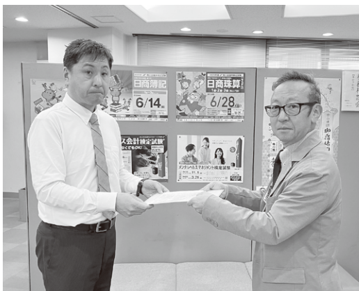
さいたま地域協議会／さいたま商工会議所