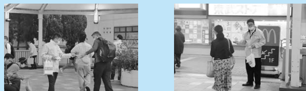
ティッシュ配りの様子