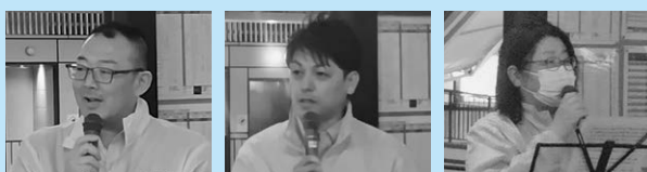
代表挨拶 迫副会長