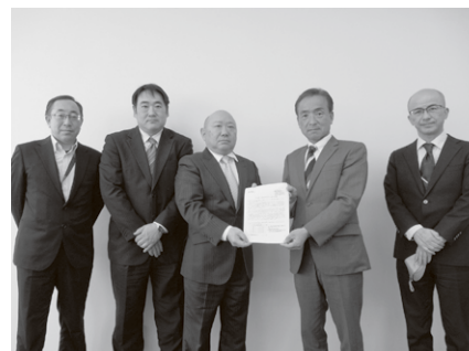
比企地域協議会／東松山商工会