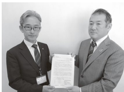
西部第四地域協議会／入間市商工会