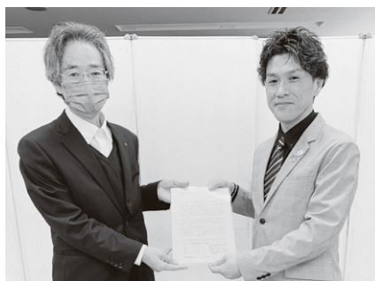
秩父地域協議会／秩父商工会議所