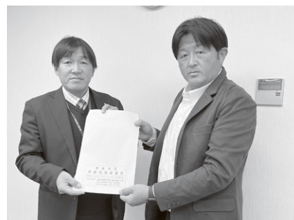
東部地域協議会／久喜市商工会