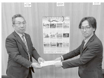
北埼玉地域協議会／羽生市商工会