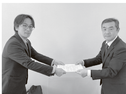
北埼玉地域協議会／加須市商工会