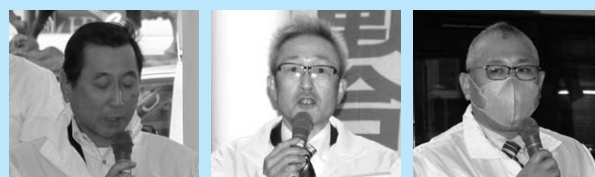
代表挨拶 関口副会長