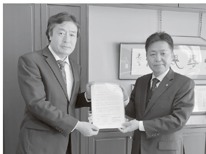
さいたま地域協議会／さいたま商工会議所