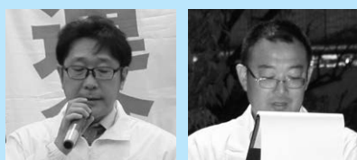
代表挨拶 高井副会長