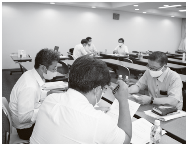
審議会に向けた意見交換

続いて、平尾事務局長から最低賃金制度の概要が説明されたのちに過去10年間の埼玉県の特定期(産業別)最低賃金の議論経過が説明されました。各年の取り巻く環境や審議会の議論の中で、その後の審議に影響を及ぼした発言や審議結果が説明され、そうした背景を