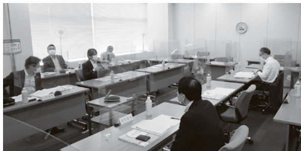
今年度の埼玉地方最低賃金審議会の会議室風景

今年度の地賃においては、6月30日(火)に第1回の審議会が開催されました。新型コロナウイルス感染症の拡大が続く中で、例年の審議会とは全く異なり、審議委員一人一人にアクリル板で前と左右を仕切り、かつ一定の距離を置いた席、さらには検温、手指消毒、体調チェックをするなどの感染防止対策をおこなった上で、公労使の審議委員が一同に出席しての開催となりました。