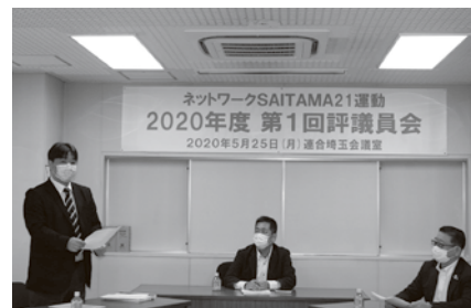
挨拶をする二階堂委員長(自動車総連)