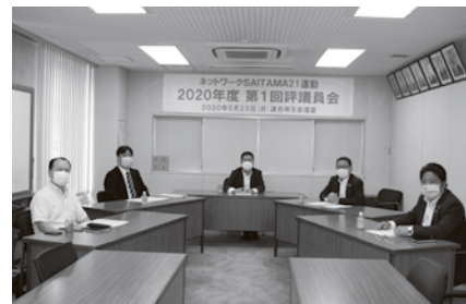
評議員会当日出席者

運営委員会では、今後もNPOをはじめとする各団体と「共生の地域社会づくり」をめざす運動を進めていきます。