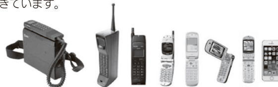
携帯電話の進化の変遷

他にも、生活様式が変化したきっかけは、もっと昔をたどれば、「電灯」により生活時間が飛躍的に伸びたり、「自動車」により人が自由に移動できたり、『三種の神器』と言われた「テレビ・洗濯機・冷蔵庫」で日常の生活スタイルが変化するなど、「生活様式」は、これまでも「新しく」変化してきました。