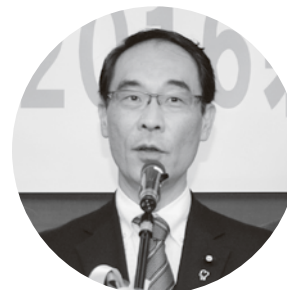
大野元裕 民主党埼玉県連代表代行・ 参議院議員

また、民主党埼玉県連を代表して挨拶いただいた大野元裕参議院議員からは、「消費者、納税者、働く者の味方として、歯を食いしばって頑張っていく」との意気込みが語られた。