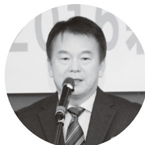
清水勇人 さいたま市長