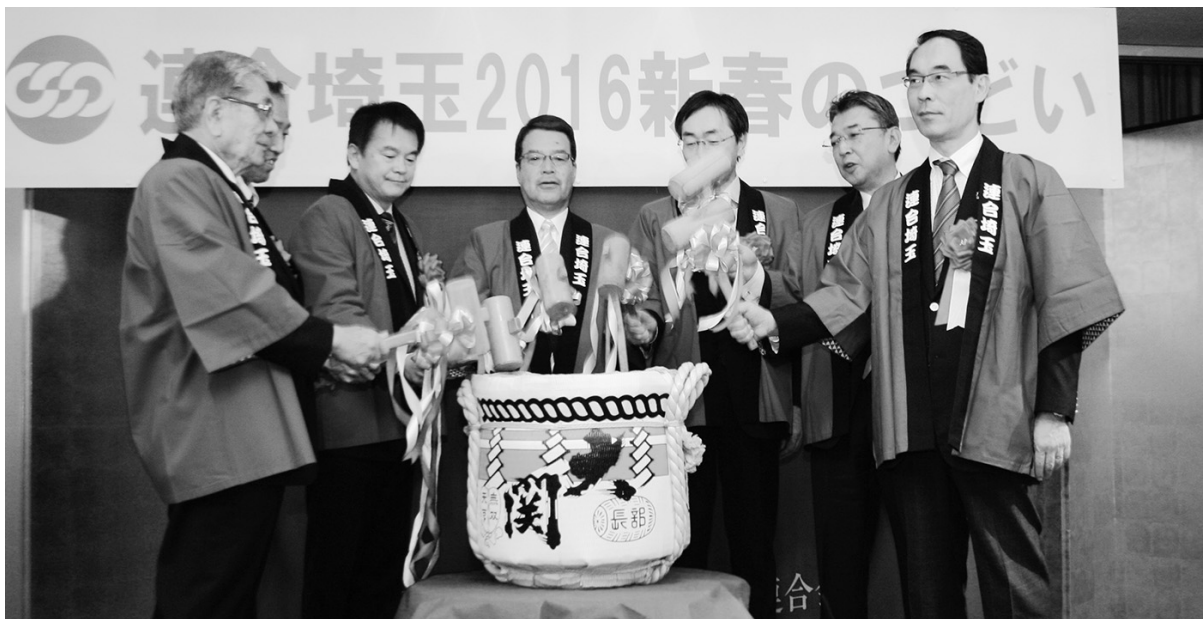
新春を祝って鏡割り