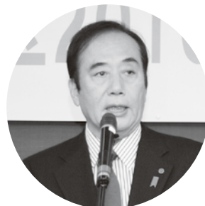
上田清司 埼玉県知事