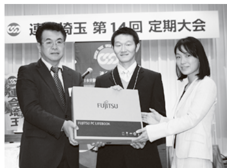
NPO団体へのパソコン寄贈