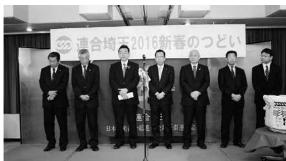
推薦・友好首長のみなさん