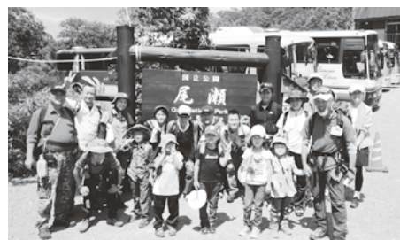
夏休み自然体験in尾瀬

このような「ネット21運動」の活動を支える貴重な資金となるのが「ふれあいコミュニティ・ファンド」で、このファンドへの寄付・募金活動のひとつが「ワンコイン運動」です。ご協力いただいた方にはその証として「ネット21運動」専用の「2016年度版ボランティア・カード」を発行します。