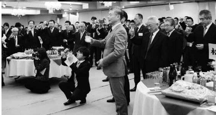
新年をスタートした連合埼玉に乾杯!