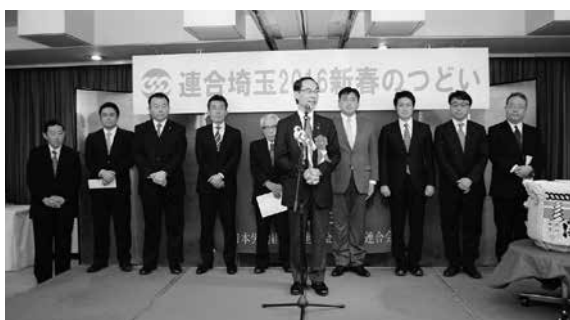
民主党埼玉県総支部連合会と 社民党埼玉県連合のみなさん