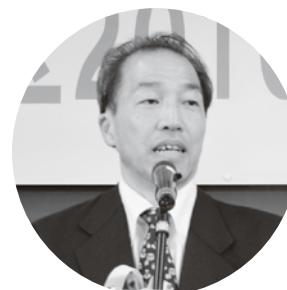
田畑一雄 埼玉労働局長