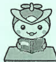
所沢市のマスコット 「トコロん」

本セミナーでは、労働契約の締結や、契約締結時に必ず取り決めがされる労働条件、退職・解雇・定年などの労働契約の終了に関するルールについて、トラブル事例を交えながら、専門家が分かりやすく解説します。