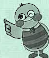
埼玉県のマスコット 「さいたまもち」