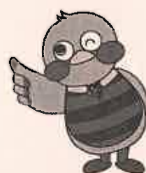
埼玉県マスコット「さいたまっちゃん」

TEL 04-2953-1111（内線2553） FAX 04-2954-6262