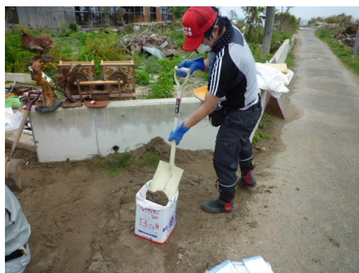
■一人で土のう詰め作業ができる、通称“土のうマシン”が活躍中。実は一斗缶の上下面を取り去った四角い筒。(13日・いわき)