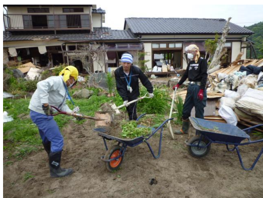
■家屋での土砂・がれき撤去作業の様子。いたるところ砂・砂・砂(13日・いわき)