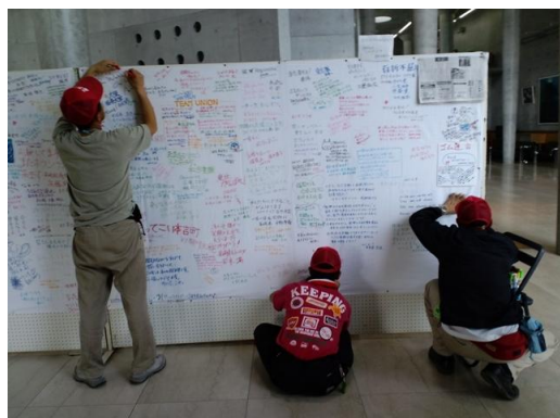
■気仙沼・本吉ボランティアセンターには全国から参加したボランティアが残した寄せ書きがある。連合のボランティア隊も復興を祈りメッセージを残す。(10日)