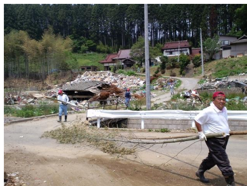
■寺から背丈の数倍ある竹を運び出す (10日・気仙沼)