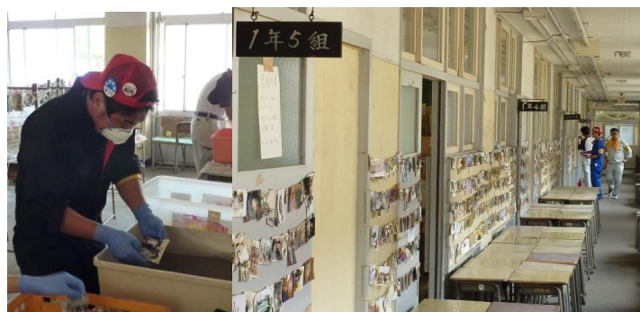
■回収された写真を洗浄する。写真を傷めず津波の泥を落とすため、慎重さが求められる。きれいになった写真は掲示され、持ち主を待つ。(14日・相馬)