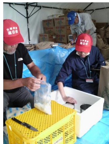
■仮設住宅の被災者に届けるコメの小分け作業。9 リットルずつ計量して袋に詰める。(12日・郡山)