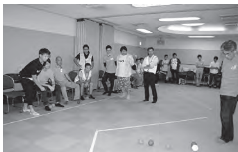
ボッチャ体験学習の様子