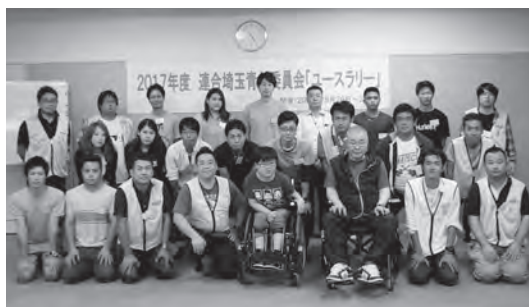
参加者のみなさん