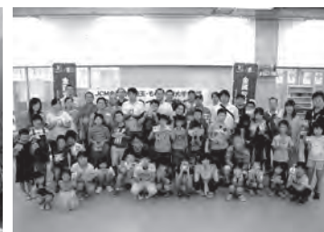
参加者のみなさん

に配置するのか、配色はどうするのか、親子で相談しながら、試行錯誤を重ねながらオリジナルコースターを完成させた。参加者からは、タイルの配置や色合いなどの苦労もあったけど、とても楽しい時間を過ごせた、とのコメントをいただいた。