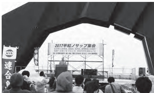
挨拶をする神津会長