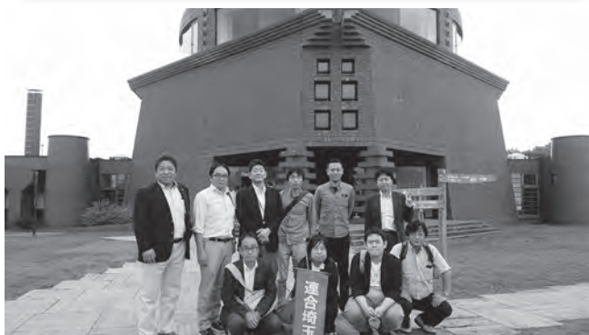
参加者のみなさん