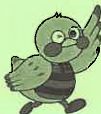
埼玉県マスコット「さいたまもっち」