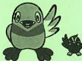
三郷市キャラクター「かいちゃん&つぶちゃん」

本セミナーでは、職場におけるセクハラ・パワハラといったハラスメントの予防、並びにメンタルヘルスの重要性について、職業相談の現場から見た事例及び判例を交えて解説します。