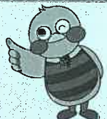
埼玉県のマスコット「さいたまっち」