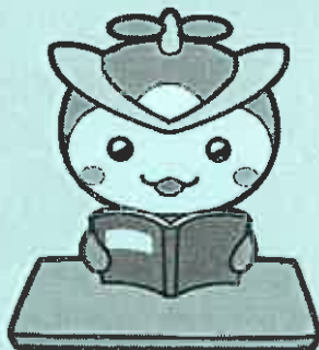
所沢市のマスコット「トコロん」