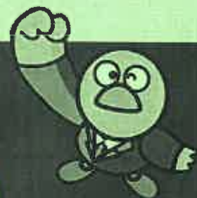
埼玉県のマスコット 「コバトン」

また、後半には、平成24年の労働契約法改正のポイントや、 実際のトラブル事例・対処法を解説します。