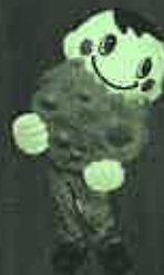
草加市観光大使 「バリボリックン」