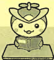
所沢市のマスコット「トコロん」