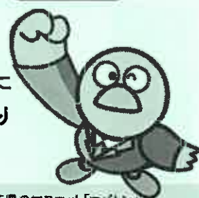
埼玉県のマスコット「コバトン」

埼玉県労働セミナーでは、勤労者、事業者、就活中の方に向けて、労働法令や労働関係の身近な問題をテーマに、より良い職場環境づくりに役立つ知識を提供しています。